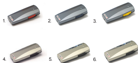
1. Selecta T10 2. Selecta T10 MIX 3. Selecta T10 MOM 4. Selecta T10 D 5. Selecta BT 6. Selecta BT/D

Selecta R20 arbeitet im Frequenzbereich 169,4-218 MHz. Da die Kanalbestimmung softwaregesteuert erfolgt, kann er mit einer ganzen Reihe von Sendern kompatibel zusammenarbeiten.